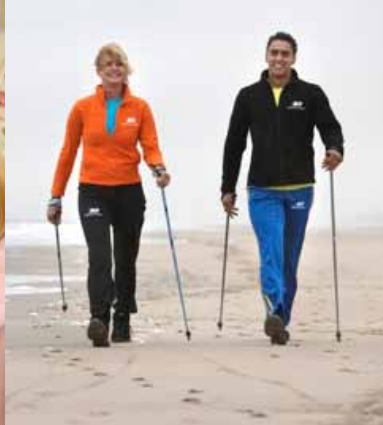
Olga en Duco zorgen voor beweging