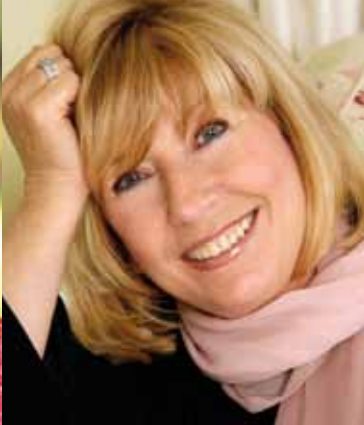
Willeke Alberti: 'We maken er een feestje van!'