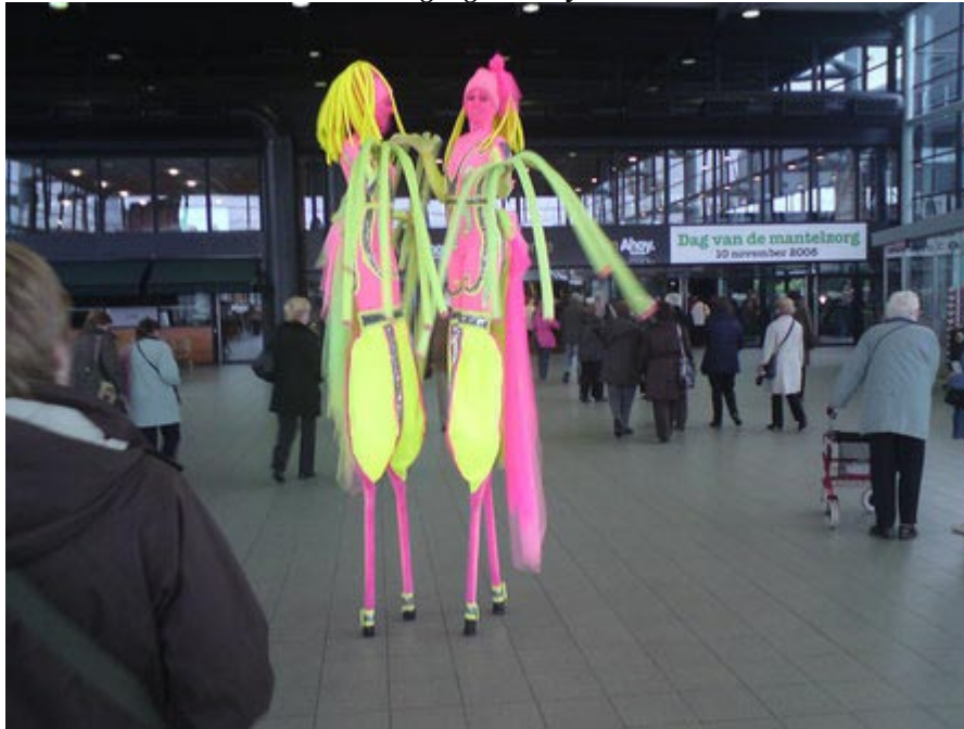
Grootse Rotterdamse mantelzorgdag in Ahoy

De Dag van de Mantelzorg 2008 was een succes. In heel het land zijn op rond de 200 plaatsen activiteiten georganiseerd om mantelzorgers in het zonnetje te zetten. Hieronder een impressie van een aantal van de evenementen.